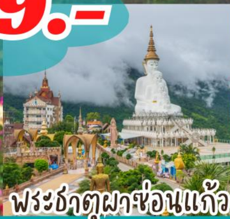
พระธาตุผาซ่อนแก้ว