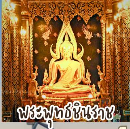
พระพุทธรูปชินราช