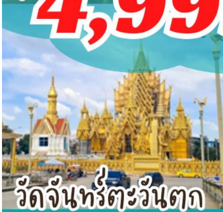
วัดจันทร์ตะวันตก