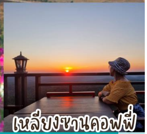
เหลียงซานคอฟฟี่