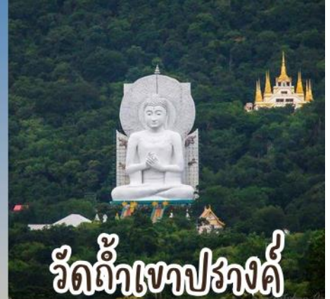
วัดน้ำเข่งปางด่