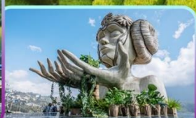
Moana Sapa Cafe