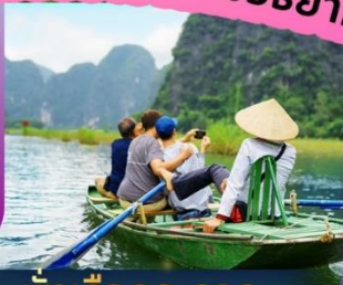
นั่งเรือกระจาด