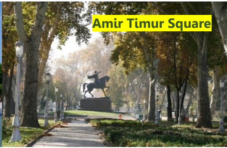
Amir Timur Square