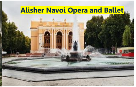
Alisher Navoi Opera and Ballet

นำท่านเข้าสู่ที่พัก Qeshbegi Hotel หรือเทียบเท่า (N1)