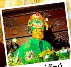
ขอพรแม่ยักย์