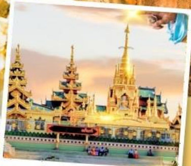
เจดีย์กลางน้ำ (สีเรียม)