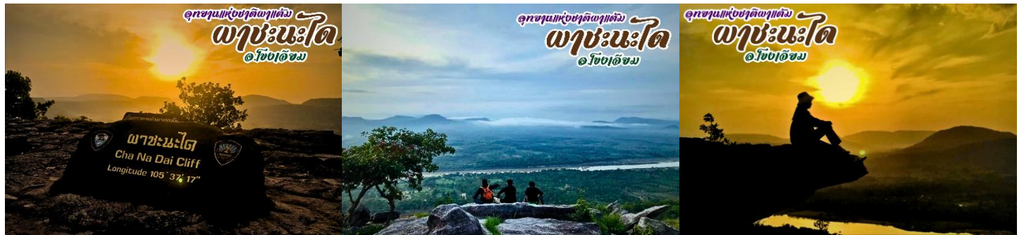
วันจันทร์ที่ 22 ก.ค. 67 ชมอาทิตย์ขึ้นที่ผาชะนะโต - เสาเฉลียง - สกายวอร์คสิรินธร - ด้านช่องเม็ก - โขงเจียม

03.30 น. ตั้งแต่เช้าขึ้นพาหนะท้องรถท้องถิ่นนำท่านเดินทางสู่ อุทยานแห่งชาติผาแต้ม เป็นอุทยานแห่งชาติที่ตั้งอยู่ทางตะวันออกเฉียงใต้ของประเทศไทย ให้ท่านได้ชมพระอาทิตย์ขึ้นได้ก่อนใครในสยาม ณ ผาชะนะโต เพราะเป็นจุดแรกของประเทศไทยที่ทางกรมอุตุฯ ใช้คำนวณอาทิตย์ขึ้น แล้วยังได้ชม วิวแม่น้ำโขง และ หินสามเส้า จากนั้นกลับเข้าที่พัก