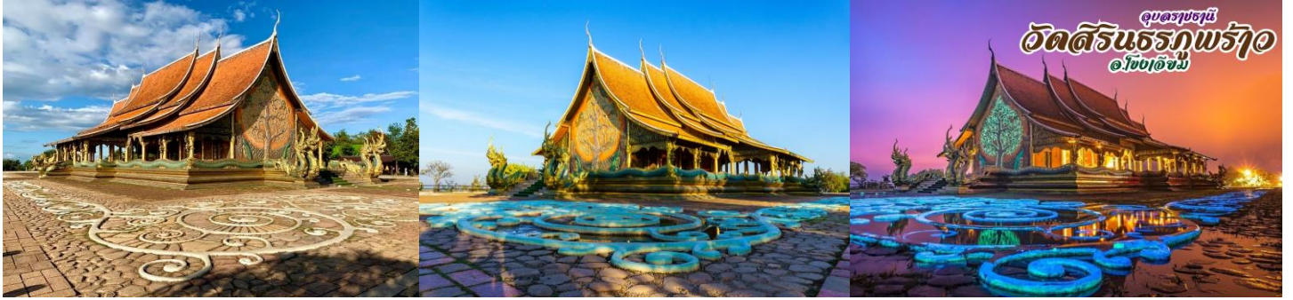
19.30 น. สมควรแก่เวลานำท่านเดินทางเข้าสู่ ที่พักอิสระกับการพักผ่อนในคำคืนอันแสนสุข