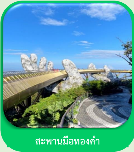
สะพานมือทองคำ