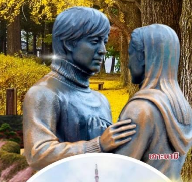
เกาะนามิ