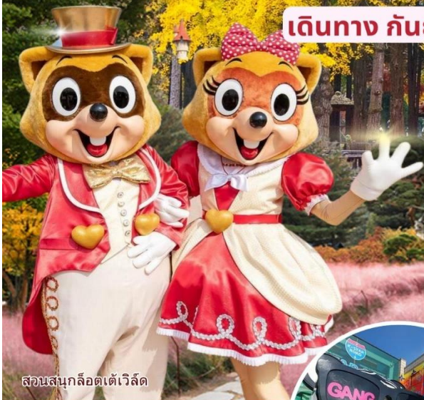
สวนสนุกลีตเต้เวิลด์