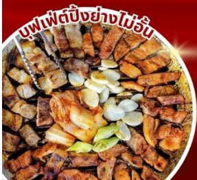
บุฟเฟ่ต์ปิ้งย่างไม่อั้น

สนุกสุดมันส์ สวนสนุกลีตเต้เวิลด์ สัมผัสบรรยากาศโรแมนติกเกาะนามิ สวนดอกไม้ Garden of Morning Calm สักการะพระพุทธรูปขนาดใหญ่ใจกลางโซล ห้องสมุดสตาร์ฟิลด์ Starfield Library ยอดเขานัมซานโซลทาวเวอร์ อิสระช้อปปิ้งคังนัม Lotte Duty Free