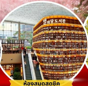
ห้องสมุดสตาร์ฟิลด์