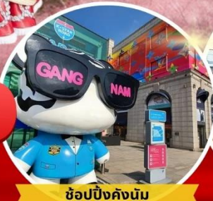
ช้อปปิ้งคังนัม