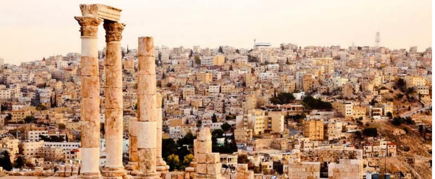
หมายเหตุ -รูปภาพใช้ประกอบในการบรรยาย โปรแกรมเท่านั้น -โปรแกรมสามารถปรับเปลี่ยนได้ตามสถานการณ์จริงและ โรงแรมที่จองได้แต่ละกรุ๊ป