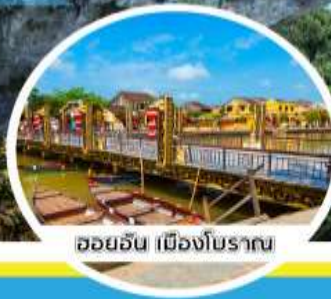
ฮอยอัน เมืองโบราณ