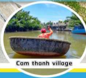
Cam thanh village