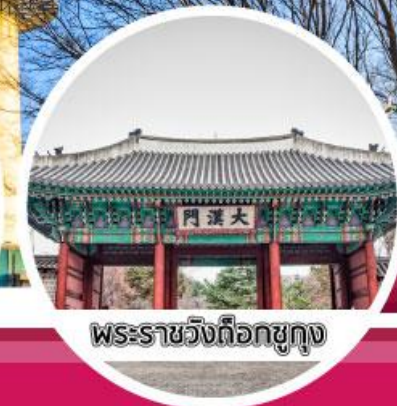
พระราชวังต็อกซูกุง