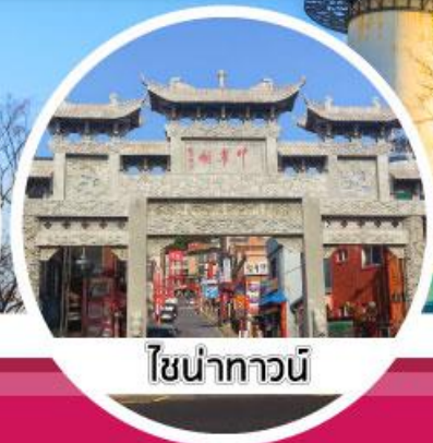
โซน่าทาวน์