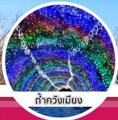
ต้าควังเมียง

1-5 / 3-7 / 11-15 พ.ค.62 19-23 / 21-25 / 25-29 พ.ค.62 27-31 / 29 พ.ค.-2 มิ.ย.62