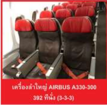
เครื่องลำใหญ่ AIRBUS A330-300 392 ที่นั่ง (3-3-3)

สายการบิน THAI LION AIR ใช้เครื่อง AIRBUS A330-300 จำนวน 392 ที่นั่ง เครื่องใหม่ ลำใหญ่ มีจอทีวี การบริการทุกที่นั่ง จัดที่นั่งแบบ 3-3-3 มีบริการอาหารว่างเสิร์ฟทั้งขาไปและขากลับ (น้ำหนักกระเป๋า 20 กก./ท่าน หากต้องการซื้อน้ำหนักเพิ่ม ต้องเสียค่าใช้จ่าย)