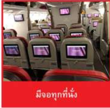
มีจอทุกที่นั่ง