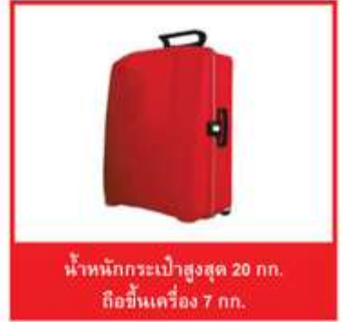
น้ำหนักกระเป๋าสูงสุด 20 กก. ถือขึ้นเครื่อง 7 กก.