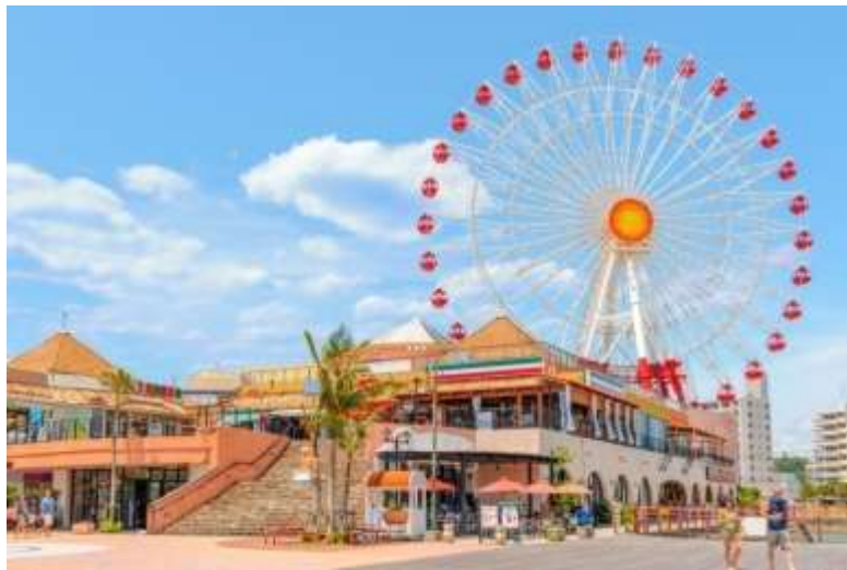
หมู่บ้านมิฮามะสไตล์อเมริกัน

ชมสวนพุทศุเอ็น สวนสไตล์จีนที่เมืองนาฮา โอะกินะวะ ก่อสร้างขึ้นในปี 1992 เพื่อฉลองวาระครบรอบสิบปีของความสัมพันธ์ในฐานะเมืองพี่น้อง ระหว่างเมืองนาฮาในโอกินะวะและเมืองฟูเจาในประเทศจีน และในเวลาเดียวกันเพื่อฉลองวาระครบรอบ 70 ปี ของการก่อตั้งเมืองนาฮา อาคารต่างๆ พร้อมทั้งสวนสร้างในสถาปัตยกรรมฟูเจา และวัสดุการก่อสร้างทั้งหมดได้ส่งตรงมาจากเมืองฟูเจา เพลิดเพลินกับบรรยากาศเมืองจีน เมื่อคุณเดินเข้าไปในสวนพุทศุเอ็น