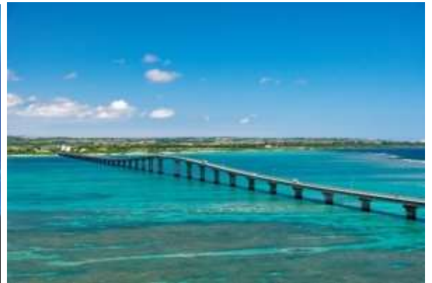
เกาะโคริ