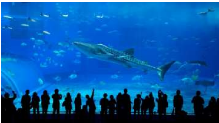
พิพิธภัณฑ์สัตว์น้ำชुरาอุมิ

เดินทางสู่ พิพิธภัณฑ์สัตว์น้ำชुरาอุมิ (Okinawa Churaumi Aquarium) ตั้งอยู่ใน Ocean Expo Park เป็นพิพิธภัณฑ์สัตว์น้ำที่ใหญ่ที่สุดในญี่ปุ่น จุดเด่นของที่นี่คือ แท็งก์น้ำคุโรชิโอะ (Kuroshio Tank) เป็นหนึ่งในแท็งก์น้ำที่มีขนาดใหญ่ที่สุดในโลก ซึ่งในแท็งก์นี้มีดาวเด่นอย่างฉลามวาฬ และปลากะเบนราหู อาศัยอยู่ นอกจากนี้ยังมีสิ่งมีชีวิตได้นำอีกมากมายไม่ว่าจะเป็นที่อาศัยตั้งแต่บริเวณน้ำตื้นถึงนอกทะเลคุโรชิโอะจนกระทั่งท้องทะเลลึก หลากหลายสิ่งมีชีวิตได้นำเหล่านี้ล้วนทำให้ผู้เข้าชมชมตื่นตาตื่นใจ ใกล้เคียงกับพิพิธภัณฑ์สัตว์น้ำชुरาอุมิ มีที่จัดการแสดงปลาโลมาแสนรู้ (Okichan Theater) เวลาแสดงรอบละประมาณ 20 นาที **กรุณาดูจอสอบรอบการแสดงก่อนเข้าชม ไม่เสียค่าใช้จ่ายเพิ่มเติม**