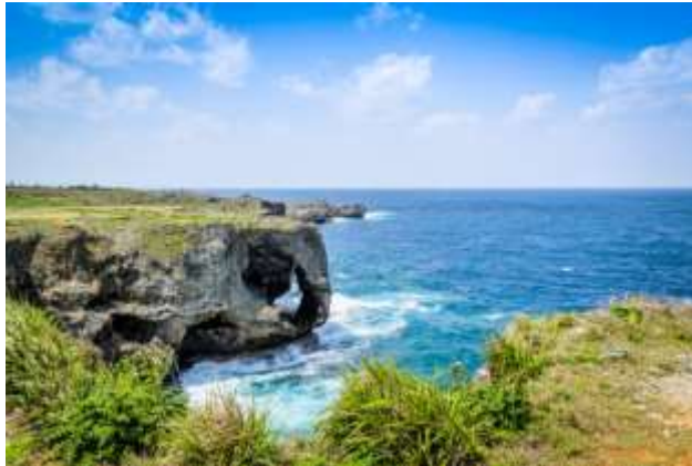
ผามันซะโมะ

นำท่านเดินทางสู่ ผามันซะโมะ (Cape Manzamo) สามารถรองรับคนที่เป็นไปได้ถึง 10,000 คน จึงเป็นที่มาของชื่อ มันซะโมะ รูปร่างของหินลักษณะคล้ายวงช้างหันหน้าออกสู่ทะเลจีนตะวันออก มีความสูงชันกว่า 20 เมตร เป็น จุดเด่นที่ผู้มาเยือนต้องถ่ายรูปคู่เป็นที่ระลึก