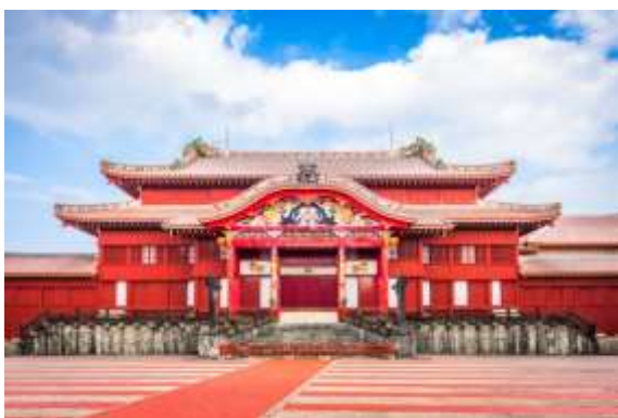
ปราสาทชูริ

นำท่านเดินทางสู่ ปราสาทชูริโจ (Shurijo Castle) ไม่รวมค่าเข้าชมตัวอาคารด้านใน เป็นปราสาทที่ใหญ่ที่สุดในโอกินาวา ได้รับขึ้นทะเบียนเป็น UNESCO World Heritage เมื่อปี 2000 ปราสาทชูริเดิม ได้สร้างขึ้นในช่วงปลายยุค 1300 ในราชวงศ์ของอาณาจักรริวกิว (The Kingdom of Ryukyu) ปราสาทแห่งนี้เคยเป็นที่ประทับของกษัตริย์ภายหลังการรวมเป็นหนึ่งเดียวของราชอาณาจักรริวกิว สถานที่แห่งนี้ได้เป็นศูนย์กลางของทั้งการเมือง, การทูต การต่างประเทศ และศิลปวัฒนธรรมในยุคสมัยของราชอาณาจักรริวกิว อาคารที่มีอยู่ในปัจจุบันสร้างขึ้นในปี 1992 รวมถึงประตูชูเรมอน(Shureimon Gate) และเนื่องจากตัวปราสาทตั้งอยู่บนเนินเขา จึงทำให้สามารถมองเห็นวิวเหนือ