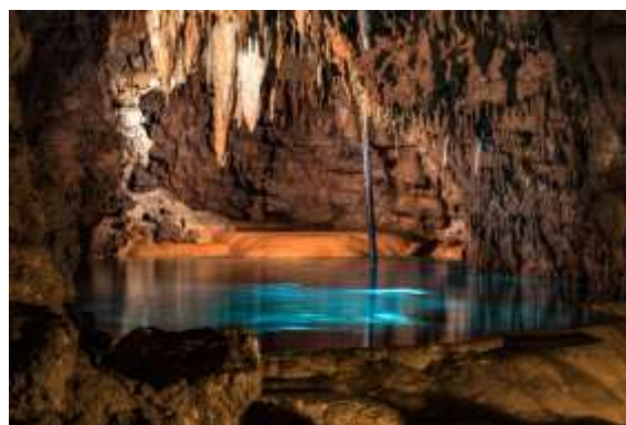
เมือง นาสะที่ งดงาม อีกด้วย