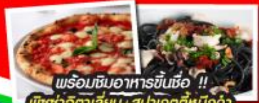
พร้อมชิมอาหารขึ้นชื่อ !! พิซซ่าอิตาลีเลียน+สปาเกตตีหมึกดำ