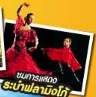
ชมการแสดง ระบำฟลามิงโก