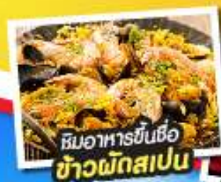
ชิมอาหารขึ้นชื่อ ข้าวพักสเปน